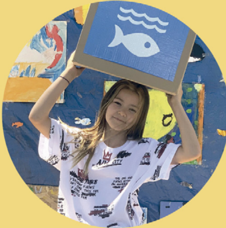
Leading the Change 11 to 14 years old