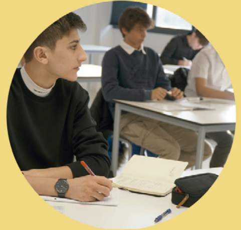
English Camp 13 to 17 years old