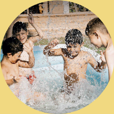
Building a New World 3 to 10 years old

Make new friends and build life skills Friendly environment Technology activities Cinema Room